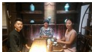
Pri čajni ceremoniji