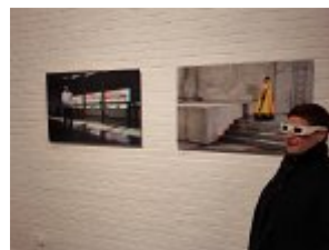
Na razstavi fotografij Matjaža Tančiča